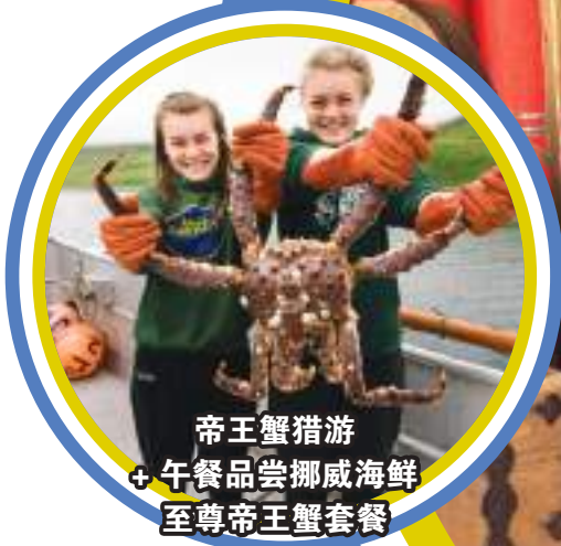
帝王蟹猎游 + 午餐品尝挪威海鲜 至尊帝王蟹套餐