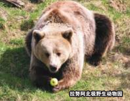
拉努阿北极野生动物园