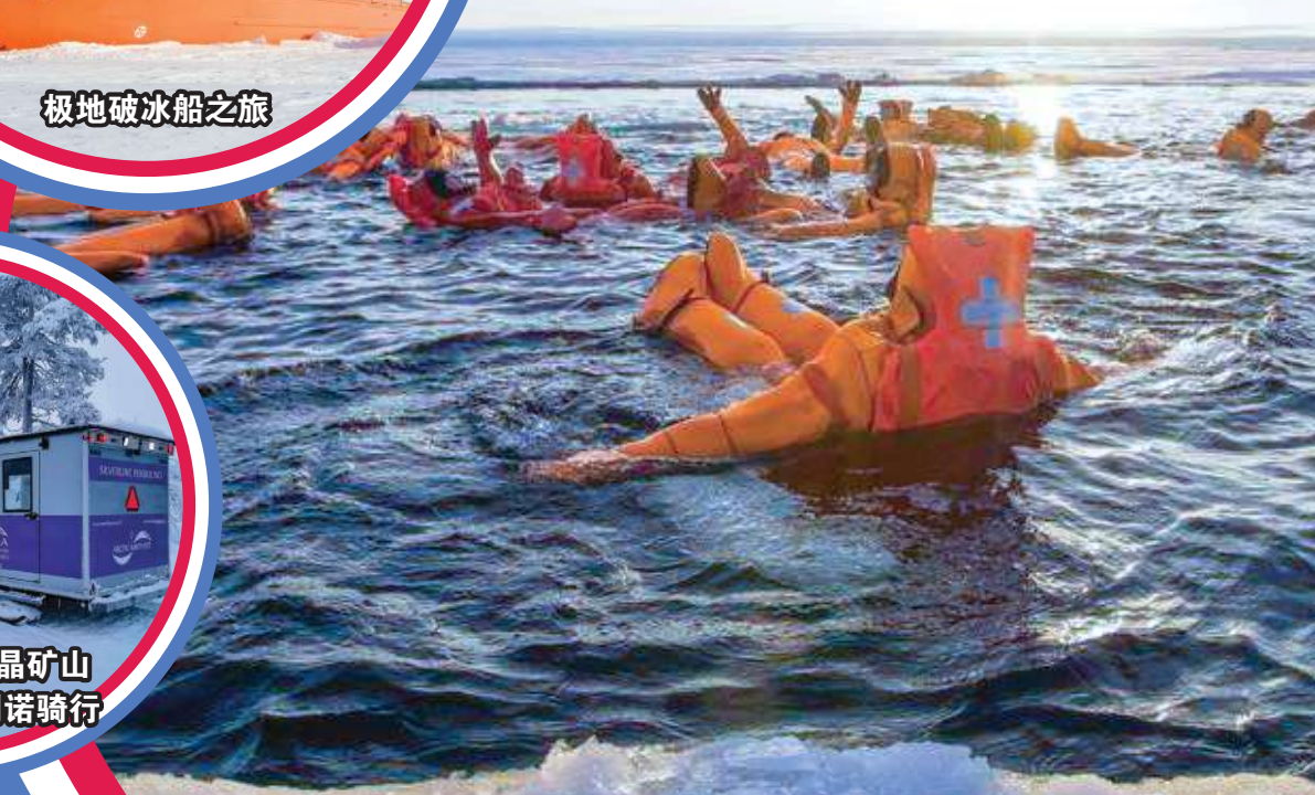
极地破冰船之旅 (体验)