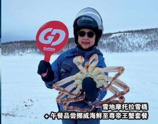
雪地摩托拉雪橇 + 午餐品尝挪威海鲜至尊帝王蟹套餐