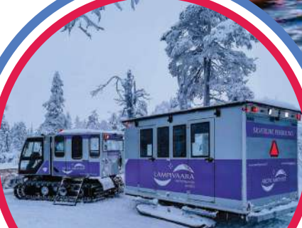
兰皮瓦拉紫水晶矿山 + 紫水晶彭多利诺骑行