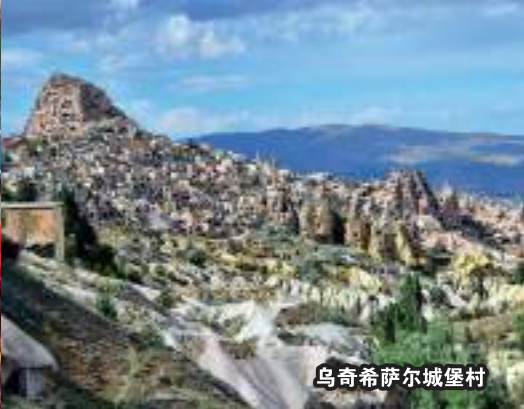
乌奇希萨尔城堡村