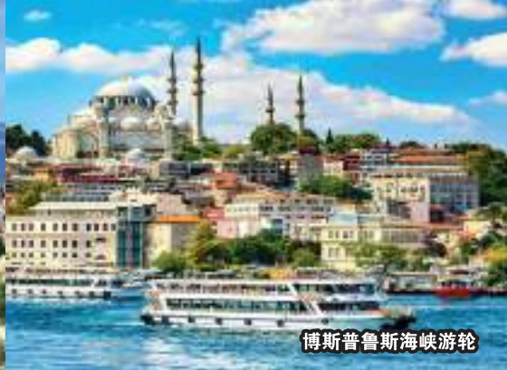
博斯普鲁斯海峡游轮