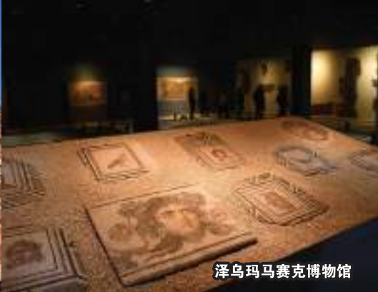
泽乌玛马赛克博物馆