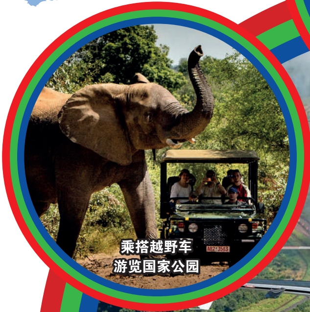
乘搭越野车 游览国家公园