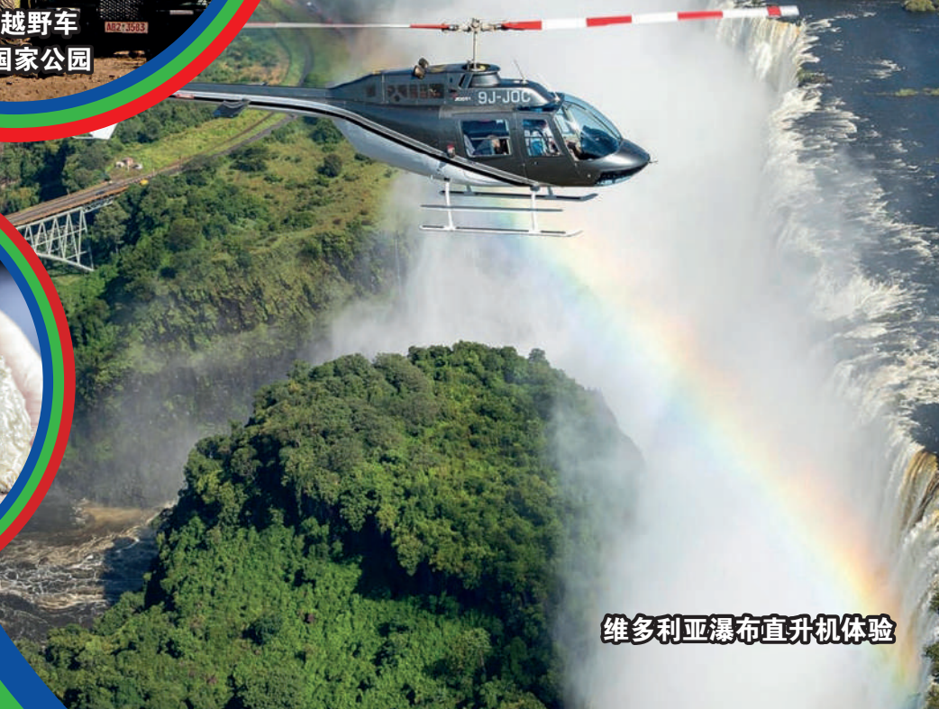
维多利亚瀑布直升机体验