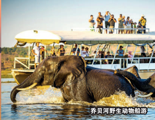
乔贝河野生动物船游