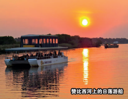
赞比西河上的日落游船