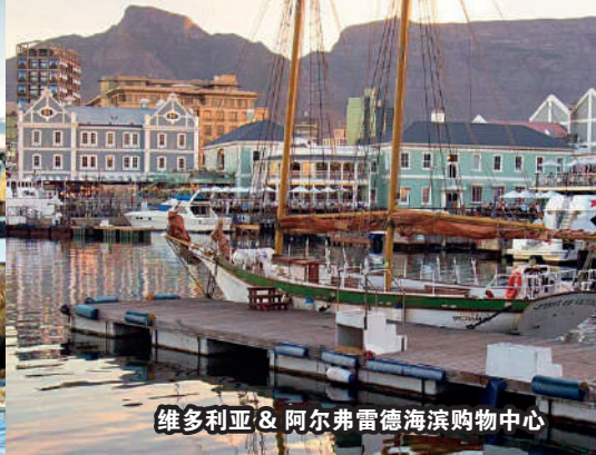
维多利亚 & 阿尔弗雷德海滨购物中心