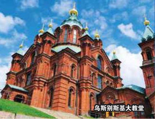
乌斯别斯基大教堂