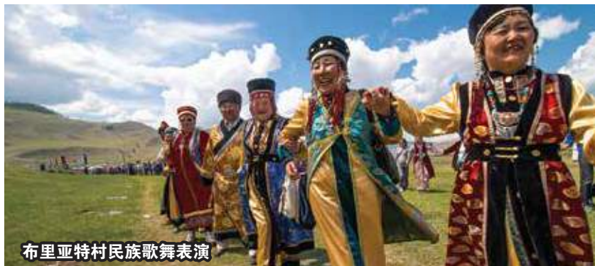
布里亚特村民族歌舞表演

*在重大会议、博览会和节日期间, 住宿可能会安排在其他城市, 恕不另行通知 *部分住宿可能没有特定的双床房或双人房类型