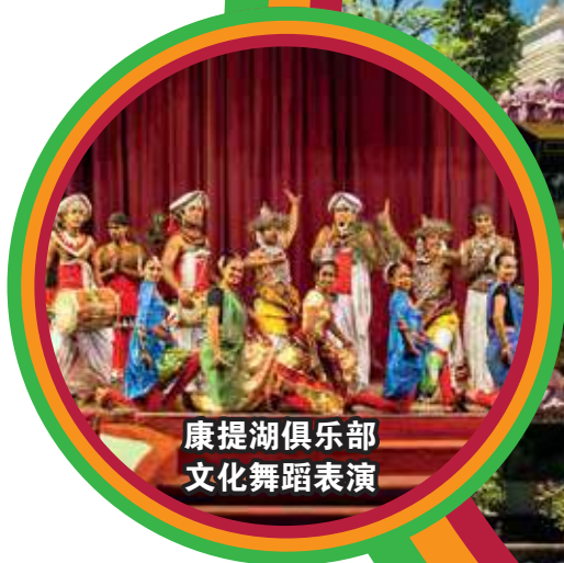
康提湖俱乐部 文化舞蹈表演