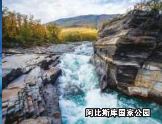
阿比斯库国家公园