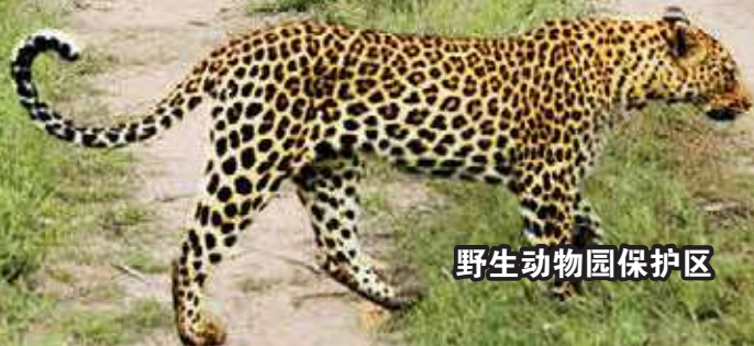
野生动物园保护区