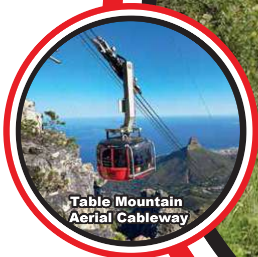
Table Mountain Aerial Cableway