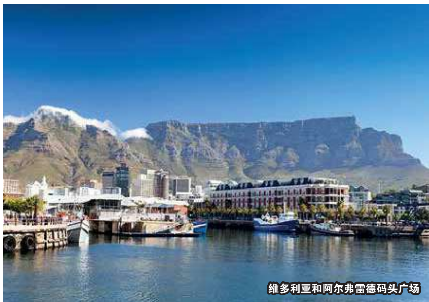
维多利亚和阿尔弗雷德码头广场