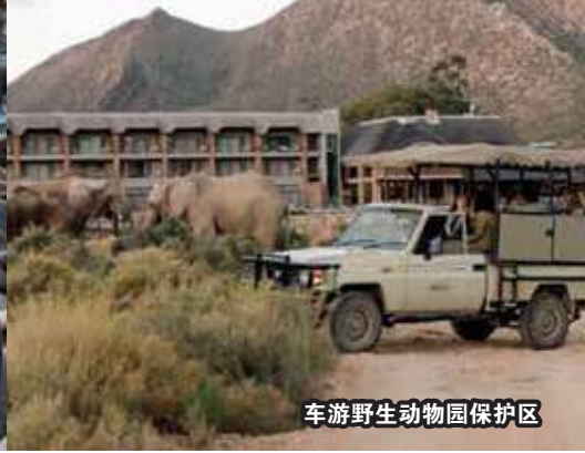
车游野生动物园保护区