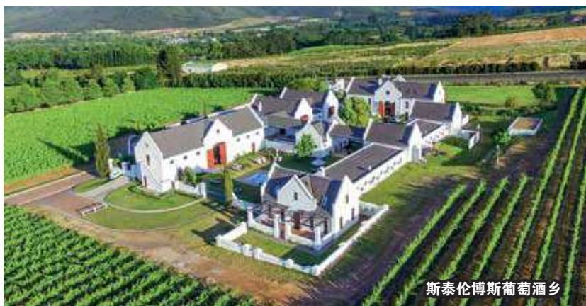
斯泰伦博斯葡萄酒乡