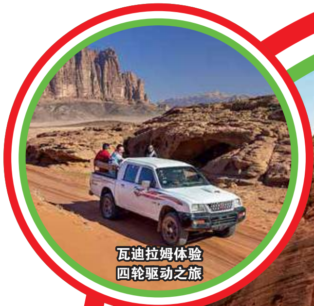
瓦迪拉姆体验 四轮驱动之旅