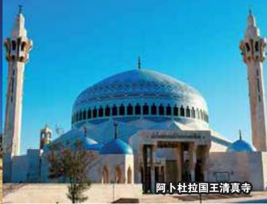
阿卜杜拉国王清真寺