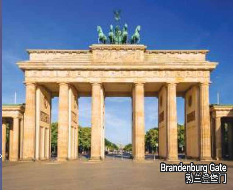
Brandenburg Gate 勃兰登堡门